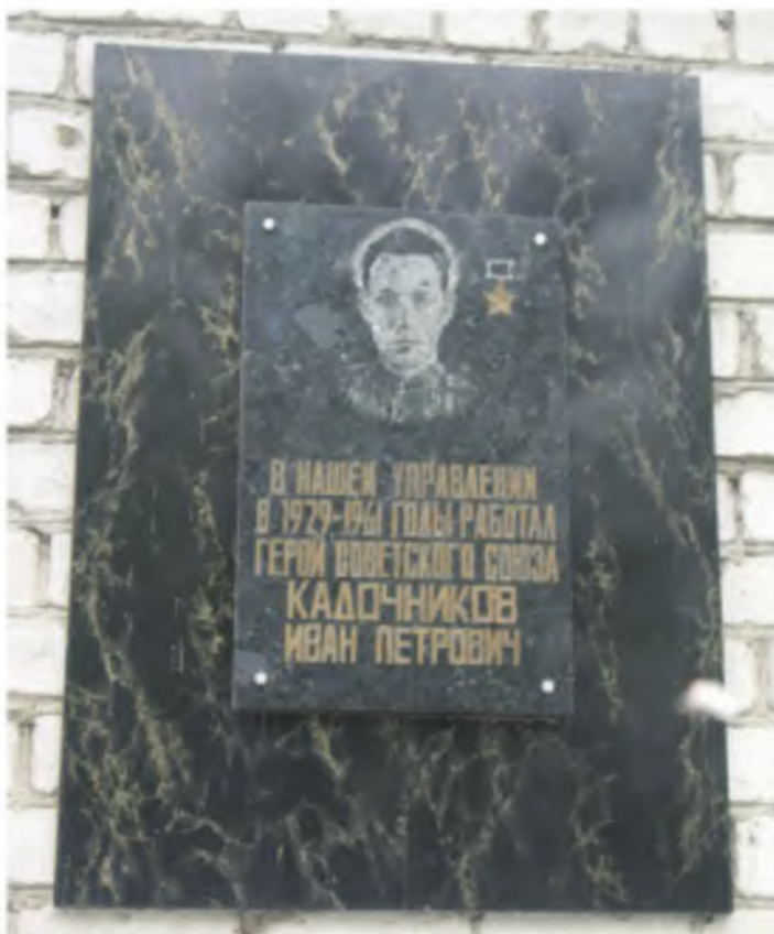
Мемориальная плита на здании управления «Электромонтаж». Установлена в 1993 г.