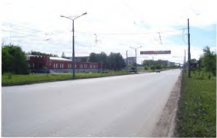
Улица им. И.П. Кадочникова г. Каменск-Уральский.