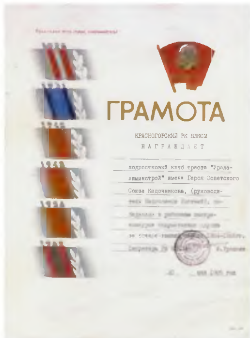
Грамота подростковому клубу им. И.П. Кадочникова