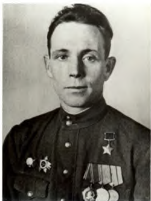
И. П. Кадочников после присвоения звания Герой Советского Союза. 1944 г.