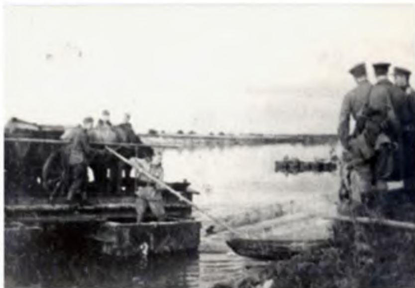
Переправа через Днепр. 1943 г.