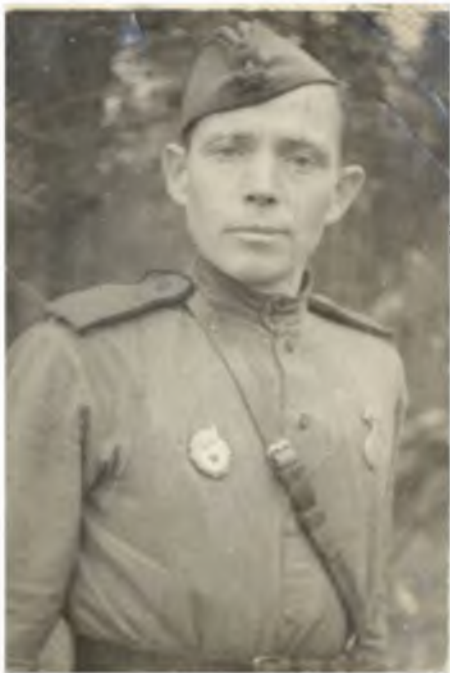
Одна из первых фронтовых фотографий И.П.Кадочникова. 1943 г.