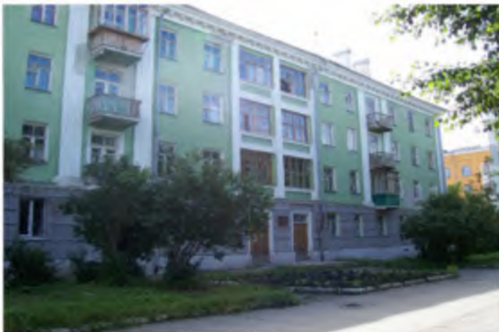
Дом в котором проживал И.П. Кадочников с 1945 по 1961 гг. Мемориальная доска Герою Советского Союза И.П. Кадочникову, ул. Алюминиевая, 6.