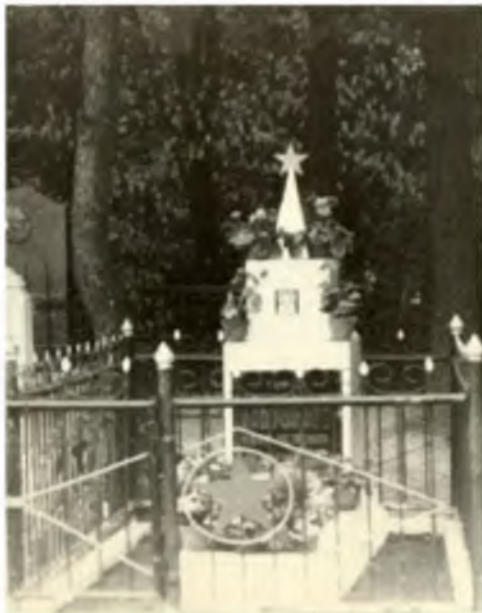
Могила И.П.Кадочникова в городе Барановичи. 1967 г.